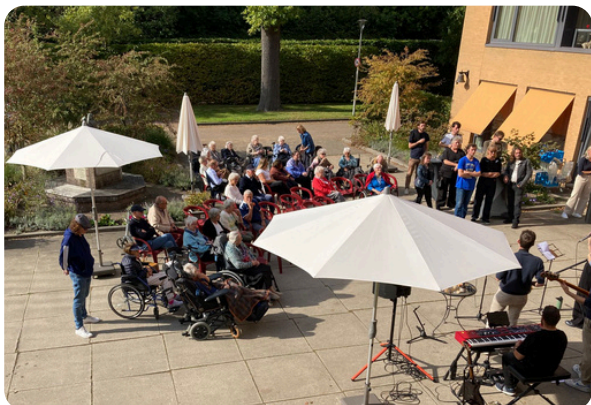
Live muziek bij Alverna

Daarnaast organiseren we diverse activiteiten bij Alverna, zoals lezingen, live muziek, ontmoetingsdiners en wandelingen. Ook gaan we samen op stap, zoals een bezoek aan SAIL.