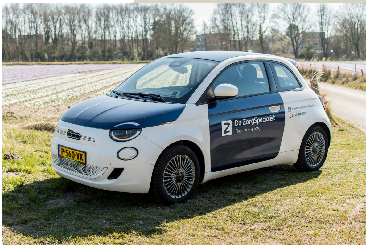
Eén van de elektrische auto's

De ZorgSpecialist heeft het volledige wagenpark ge-elektrificeerd.