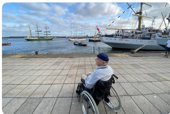
Uitje naar SAIL